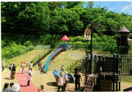
サ高住のある「海賊公園スクエア」には、子どもと親が遊べるアスレチック公園などがある

2年前にオープンしたサ高住は満室になり、現在入居待ちの方々については、デイサービスや訪問看護・介護や訪問リハビリなどで受け入れています。内科医として2週間に1度訪問診療をしながら、代表取締役として運営管理をしています。このように、子ども・親・高齢者の3世代が安心して暮